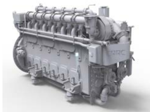
图像显示可能不反应实际柴油机

Image display may not reflect the actual engine