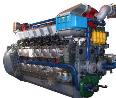
图像显示可能不反映实际柴油机