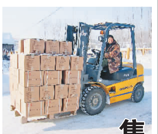
□文/摄 张杰 郭帅 本报记者 潘宏宇 白云峰

为扩大学前教育资源,我省还积极扶持民办幼儿园,加强城市住宅小区配套幼儿园建设。各县(市、区)依托城镇小区配套建设幼儿园,农村依托乡镇中心幼儿园办分园或依托村小学办附属园。在人口居住分散、交通不便、不具备集中办园条件的偏远农村地区,依托乡村幼儿园,为散居儿童和家长提供灵活多样的学前教育巡回指导,努力实现学前教育的“广覆盖”。据了解,今后几年,我省还将采取名园办分园、名园办农园、名园办民园、名园扶持薄弱园等方式,不断扩大优质学前教育资源。同时,遵循幼儿身心发展规律,坚持科学保教,不断纠正“小学化”倾向,努力实现学前教育“有质量”。